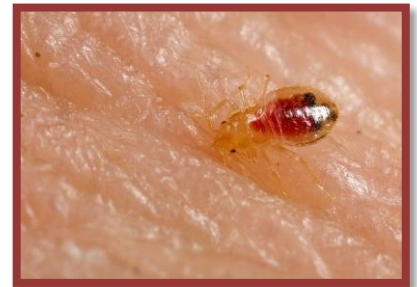
Punaise de lit se nourrissant de sang

Vous pouvez ensuite envisager le recours aux services d'une entreprise de gestion parasitaire. Dans ce cas, la rubrique Comment choisir une entreprise de gestion parasitaire? vous apprendra notamment que les entreprises de gestion parasitaire faisant l'usage de pesticides doivent être titulaires d'un permis et qu'elles doivent avoir à leur emploi une personne titulaire d'un certificat pour l'utilisation de pesticides.