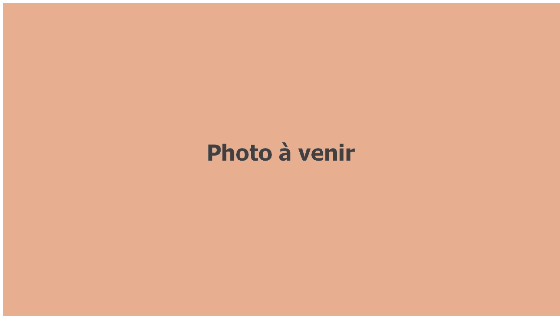
Figure 3. Affiche d'un événement de mobilisation citoyenne qui pourrait avoir lieu en 2060?

Comment expliquer cette triste répétition de l'histoire? Comment la situation environnementale et sanitaire a-t-elle pu être négligée à ce point pendant tout ce temps? Verra-t-on dans 38 ans la situation se répéter? (voir figure 3).