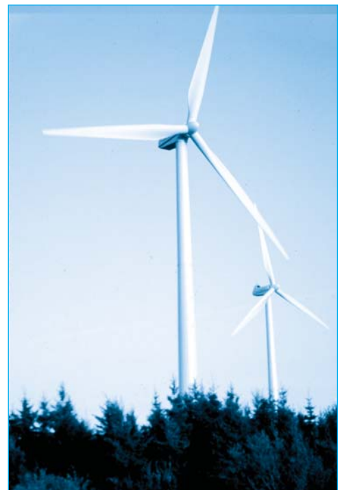
L'énergie éolienne permet au Québec de diversifier ses sources d'énergie renouvelable.

La capacité des entreprises à gérer les risques environnementaux aura un impact considérable sur leur performance et leur compétitivité. L'accès aux capitaux, aux clients et aux grands décideurs dépend d'ailleurs de plus en plus de la performance environnementale des entreprises.