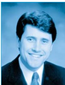
M. Jean-François Simard, ministre délégué à l'Environnement et à l'Eau

Le présent rapport, préparé par le Comité interministériel sur le développement durable, témoigne du sérieux de la démarche québécoise. Inspiré par la Déclaration de Rio et par le programme Action 21, le gouvernement du Québec poursuit sans relâche la promotion du développement durable. La lutte contre la pauvreté, la réduction des gaz à effet de serre, le maintien de la diversité biologique, la prévention de la pollution sous toutes ses formes et la gestion intégrée de l'eau constituent autant d'objectifs qui appellent à la mobilisation et à la participation de la société civile: les femmes, les jeunes, les communautés autochtones, les organisations non gouvernementales, les collectivités locales, les travailleurs et leurs syndicats, les représentants du commerce et de l'industrie, la communauté scientifique et technique et les agriculteurs.