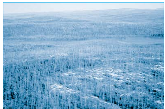
La forêt modèle crie de Waswanipi

Le Québec a mis en place un fonds quinquennal de développement de 125 millions de dollars pour les Autochtones. Ce fonds comprend deux volets: un volet pour le soutien des initiatives autochtones en matière de développement économique et un volet pour la réalisation des projets d'infrastructures communautaires.