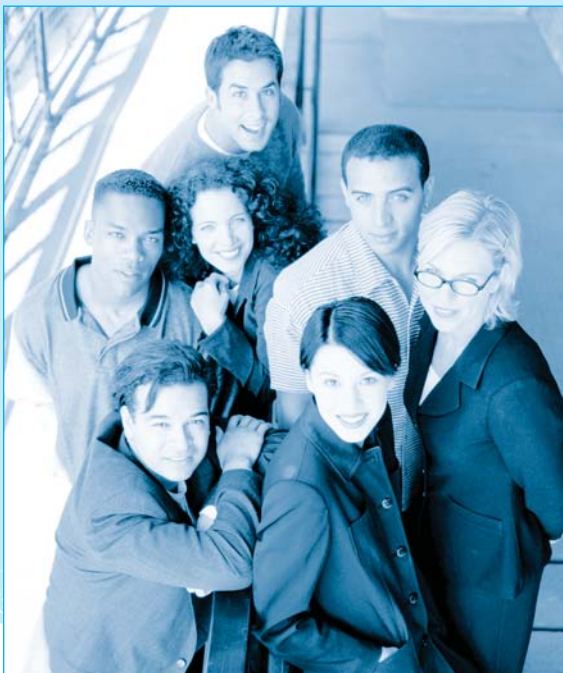
Ministère des Relations avec les citoyens et de l'immigration

Les jeunes sont prêts à relever les défis de l'avenir.