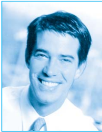
M. André Boisclair, ministre d'État aux Affaires municipales et à la Métropole, à l'Environnement et à l'Eau

Le Québec est heureux de participer au Sommet mondial sur le développement durable, qui se tient à Johannesburg, en Afrique du Sud, du 26 août au 4 septembre 2002. La Commission du développement durable de l'Organisation des Nations Unies, qui coordonne le Sommet, a demandé à tous les États de faire un rapport sur la mise en œuvre du développement durable et sur les défis à relever en cette matière. À l'instar des autres nations du monde, le Québec présente donc le bilan du travail qu'il a accompli à cet égard depuis la tenue du Sommet de la Terre à Rio, il y a 10 ans.