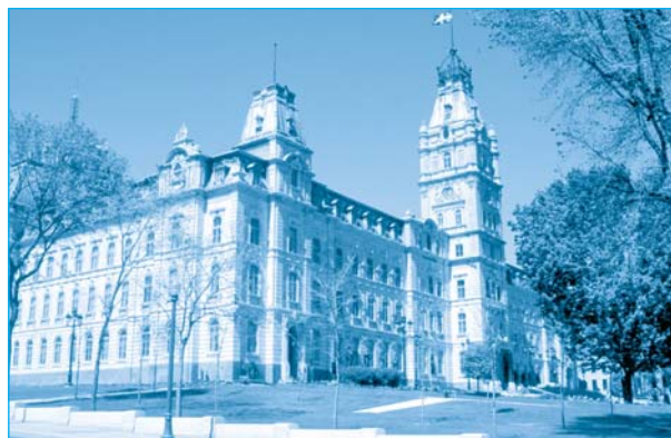
Le Parlement où siège l'Assemblée nationale du Québec.

Créé en 1791, le Parlement québécois est l'un des plus anciens du monde. Un peu plus jeune que le Congrès américain, il est contemporain de l'Assemblée nationale française.