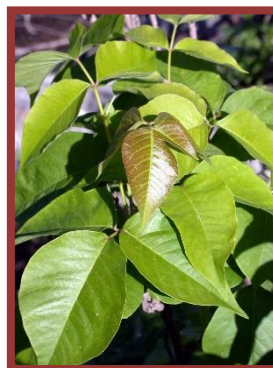
Herbe à puce

L'inflammation de la peau est le résultat de la réponse immunitaire du corps humain. La dermatite n'est donc pas transmise à un autre individu par le contact des plaies, sauf si l'urushiol est encore présent sur la surface de la peau. Un grand nombre d'animaux et d'oiseaux sont complètement insensibles, parce que leur système immunitaire est différent de celui des humains.