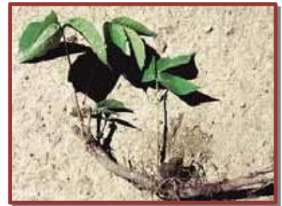
Parties aériennes et rhizomes