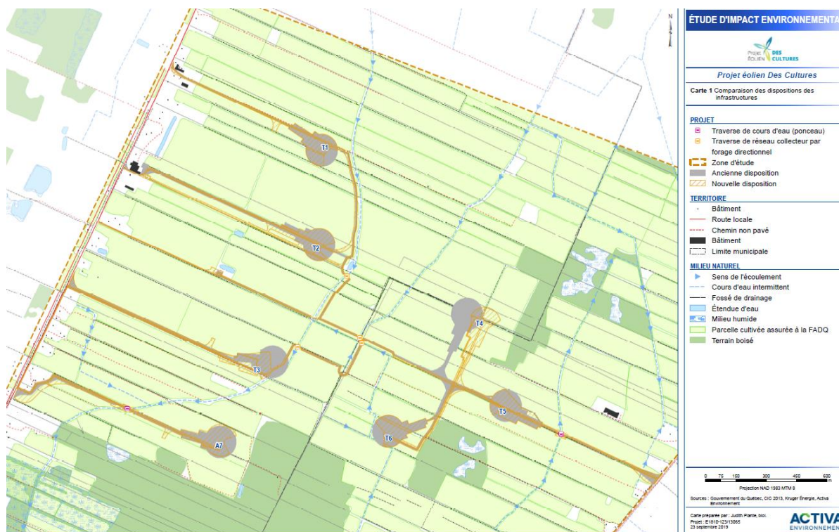
FIGURE 2 : LOCALISATION DES INFRASTRUCTURES