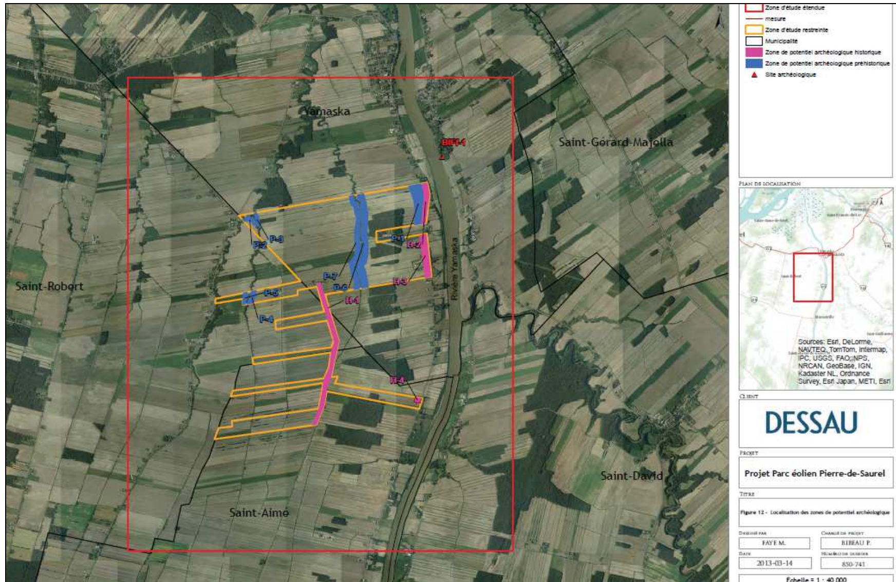
FIGURE 2- ZONES DE POTENTIEL ARCHÉOLOGIQUE