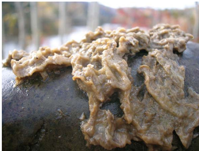
Amas de l'algue Didymosphenia geminata sur une pierre récoltée dans la rivière Matapédia, aux Portes de l'Enfer.

On rapporte que le plus important effet potentiel étudié de Didymo pourrait être la hausse du pH des rivières le jour, à des biomasses aussi élevées que celles observées en Nouvelle-Zélande. L'effet prolongé des niveaux élevés de pH pourrait nuire aux organismes sensibles à ce changement.