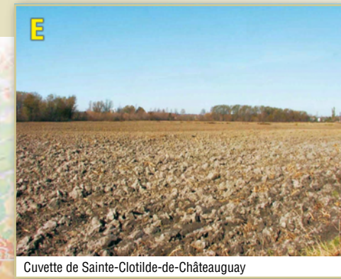
Cuvette de Sainte-Clotilde-de-Châteauguay