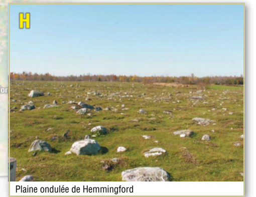
Plaine ondulée de Hemmingford