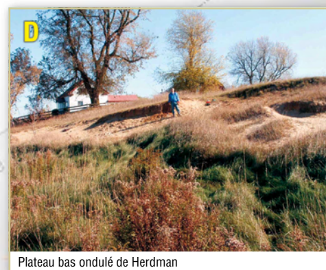
Plateau bas ondulé de Herdman