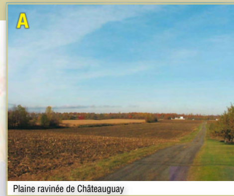
Plaine ravinée de Châteauguay