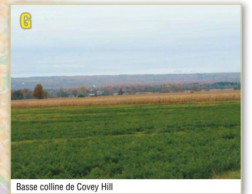
Basse colline de Covey Hill