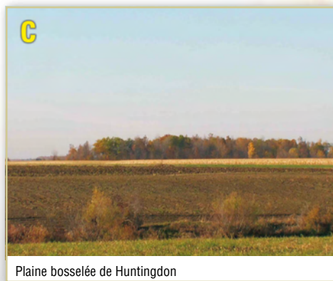
Plaine bosselée de Huntingdon