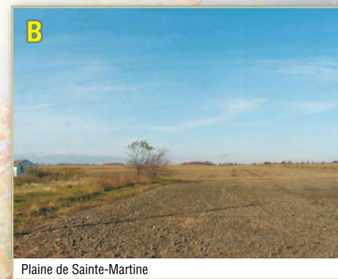
Plaine de Sainte-Martine