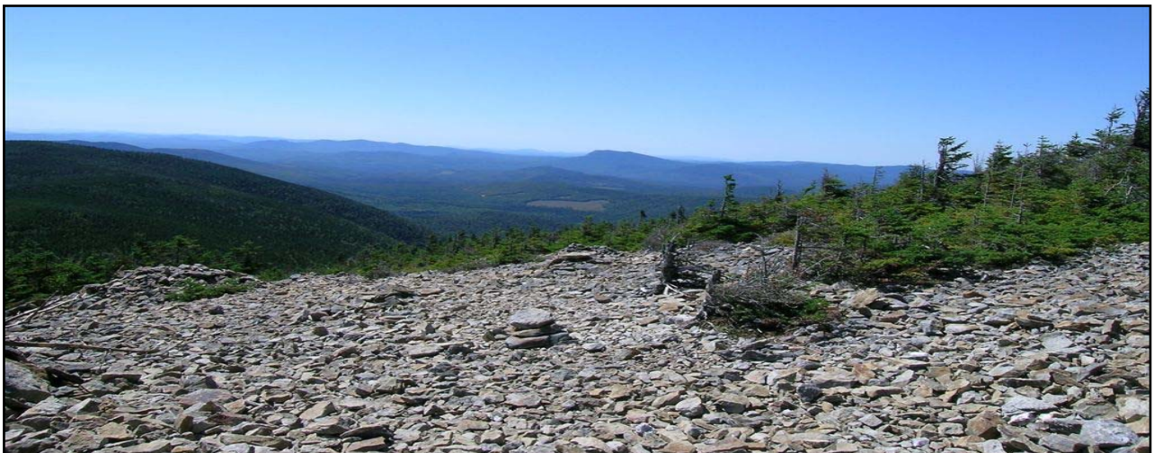
Photo 1 : Pierrier au sommet du mont Gosford, formé par l'altération de la roche en place.

Relief et Géologie : Le mont Gosford est le plus haut sommet du sud du Québec et le 7 e au Québec. En raison du relief, les sols sont très minces et formés de till. La géologie du mont et du territoire environnant est unique en Estrie. Le territoire fait partie du massif des Chain Lakes, un bloc supracrustal qui a longtemps constitué un élément énigmatique de l'orogénèse des Appalaches. Le massif est surtout constitué de métasédiments et d'un peu de roches métavolcaniques. Au Paléozoïque, entre 685 et 483 millions d'années environ, des sédiments se sont déposés dans un bassin avant-arc sur la rive occidentale de l'océan Iapetus. Autour de 470 millions d'années, des intrusions de magmas reliés à la formation de l'arc ont provoqué la fusion partielle des sédiments et leur transformation en diatexite. D'un point de vue physiographique, le massif des Chain Lakes s'inscrit dans la continuité des montagnes Blanches du New Hampshire et du Maine.