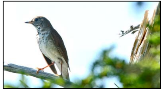
Photo 3. La grive de Bicknell.

La réserve écologique constitue l'une des rares aires de nidification répertoriées dans le sud du Québec pour certains oiseaux caractéristiques de la forêt boréale tels que le tétras du Canada, le mésangeai du Canada, le bruant fauve et la paruline rayée. La grive de Bicknell, un oiseau désigné vulnérable au Québec et considéré menacé au Canada, niche également dans la réserve écologique.