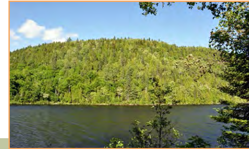
Le lac Roberge, en bordure de la route 159

** Sauf si le ministre de l'Environnement et de la Lutte contre les changements climatiques a donné son autorisation.