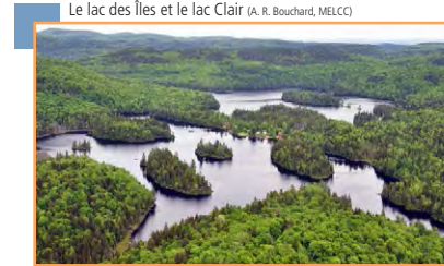
Le lac des Îles et le lac Clair