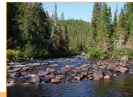
Rivière Godbout (D. Boisjoly MDDEP)