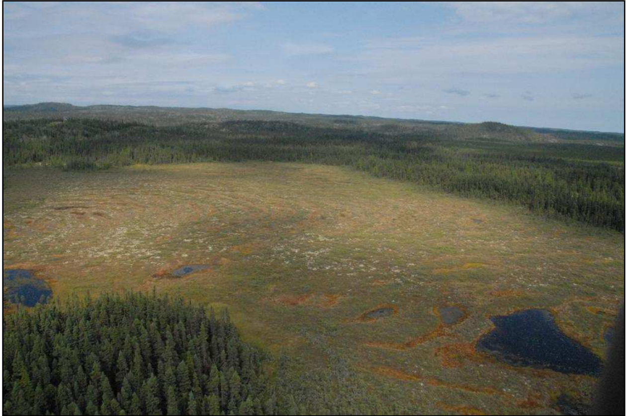
Tourbière ombrotrophe bombée excentrique localisée dans la partie sud du territoire

Faune : Au point de vue faunique, toutes les espèces typiques du milieu boréal sont susceptibles de fréquenter la réserve écologique. Mentionnons, entre autres, la loutre, le renard, le rat musqué, l'ours noir, l'orignal et le castor. Le caribou forestier, un écotype désigné vulnérable au Québec, est aussi présent de façon sporadique dans la réserve écologique. Chez les poissons, le saumon atlantique et l'omble de fontaine sont les deux espèces typiques des rivières de la Côte-Nord qui se rencontrent dans la rivière Matamec. De plus, plusieurs lacs de la réserve écologique sont habités par l'omble de fontaine. Quelques autres espèces moins abondantes, comme l'épinoche à trois et à neuf épines, l'éperlan arc-en-ciel, et l'omble chevalier fréquentent également le lac Matamec ou ses tributaires.