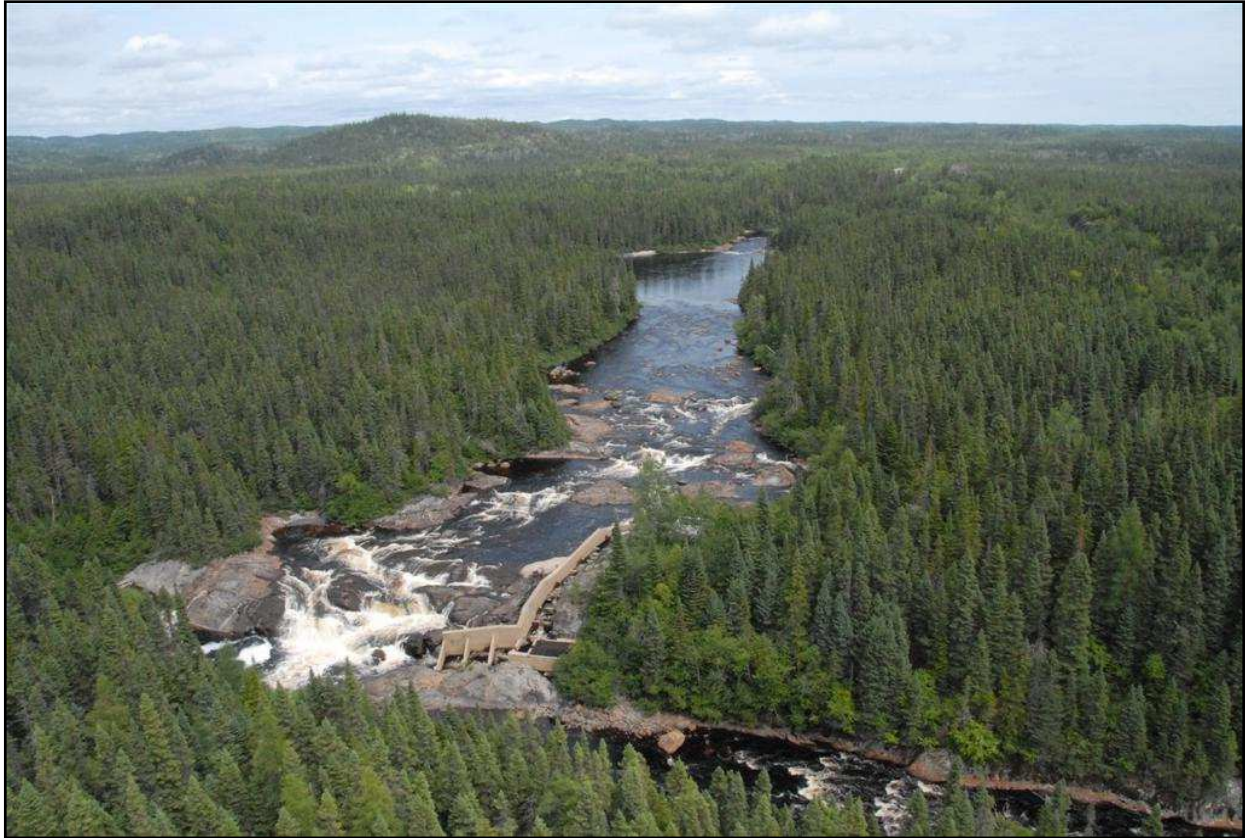
Passe migratoire du saumon sur la rivière Matamec

En 1984, l'institut de recherche doit fermer ses portes faute de fonds. Certains travaux ont tout de même été poursuivis, dont un programme de monitoring mis sur pied en 1981 pour suivre la qualité de l'eau des rivières de la Côte-Nord et un programme de biomonitoring datant de 1987 sur la réponse des communautés biologiques face aux précipitations acides. Ces deux programmes de suivi, gérés par le ministère canadien des Pêches et des Océans ont pris fin en 1996.