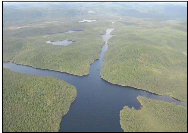
Lac La Croix

La rivière Matamec coule dans sa plus grande partie sur le substratum rocheux. Cinq chutes importantes caractérisent l'aval de la rivière où le dénivelé atteint 120 m à environ 6 km du rivage. La rivière aux Rats Musqués se jette dans la Matamec à environ 2 km de son embouchure. Les eaux de la Matamec se caractérisent par des eaux froides, très douces, bien oxygénées et peu minéralisées typique des milieux oligotrophes. Cette faible minéralisation confère à ces eaux un pouvoir tampon très limité.