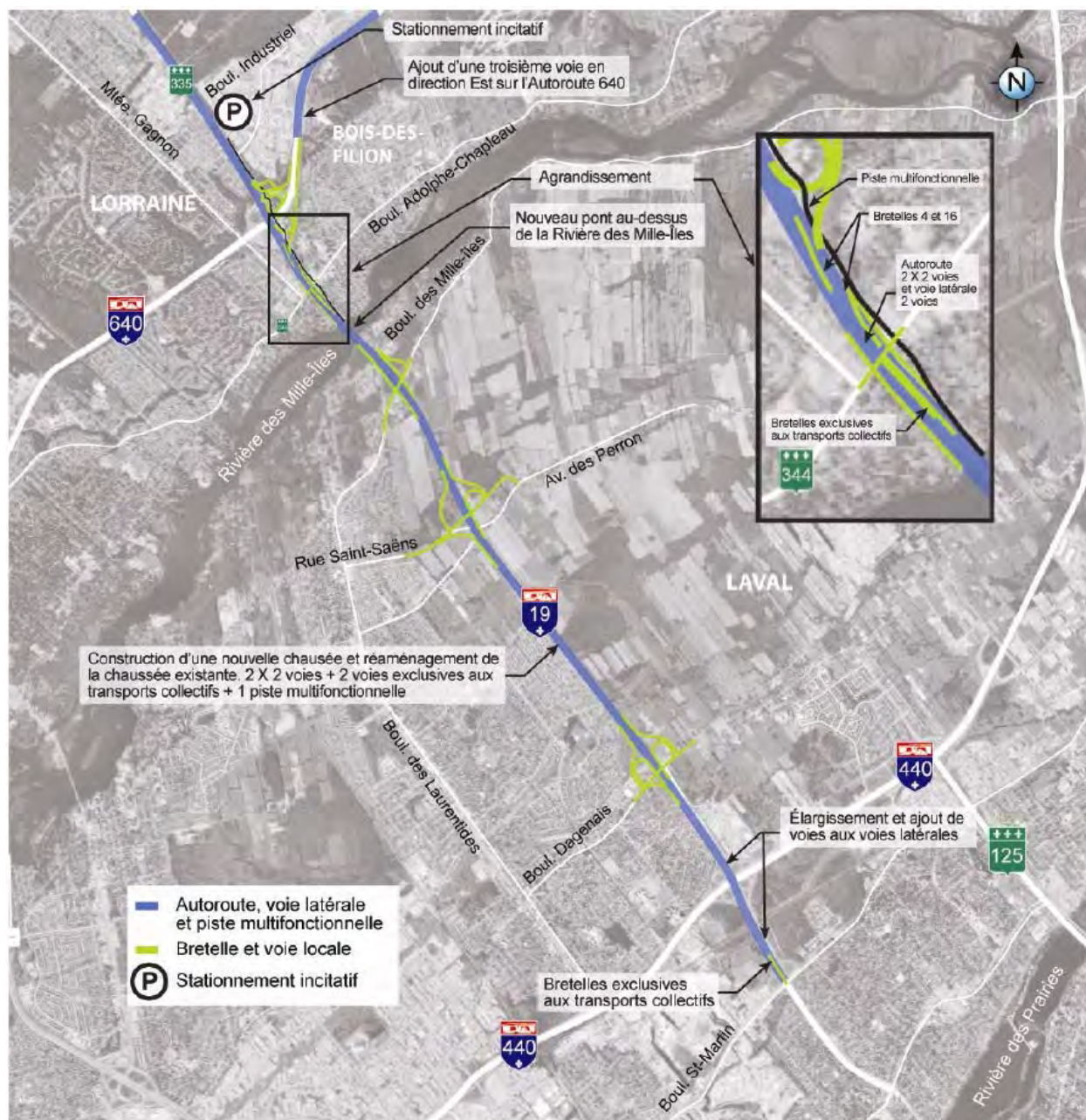
FIGURE 2 : PRINCIPALES CARACTÉRISTIQUES DU PROJET DE PARACHÈVEMENT DE L'AUTOROUTE 19