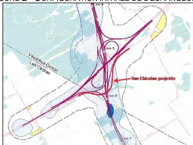
FIGURE 2 - CONFIGURATION INITIALE DE L'ÉCHANGEUR A-20/A-30/A-540

Dans le projet initial, un pont d'étagement devait être aménagé afin d'assurer le maintien de la continuité de la rue Chicoine entre le territoire de la municipalité des Cèdres et de la ville de Vaudreuil-Dorion. Selon les plans du projet de référence, la conception de l'échangeur A-20/A-30/A-540 nécessitait l'aménagement de voies collectrices permettant l'accès aux bretelles reliant les autoroutes. Selon le MTQ, cette conception aurait engendré une réduction significative des vitesses dans les courbes prononcées et ne permettait pas d'avoir un échangeur directionnel entre la nouvelle autoroute 30 et l'autoroute 20. À la suite de ces constatations, la conception de l'échangeur a été revue et c'est le concept actuel qui a été transféré à Nouvelle Autoroute 30, S.E.N.C. par le biais de l'entente de partenariat de septembre 2008.