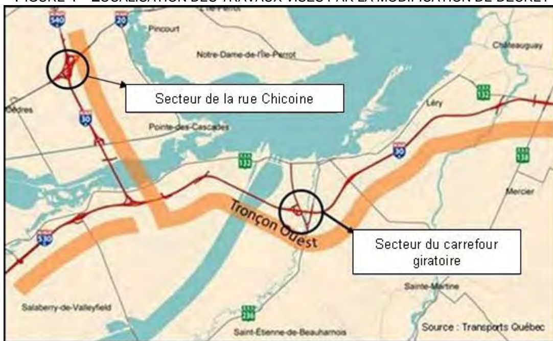
FIGURE 1 - LOCALISATION DES TRAVAUX VISÉS PAR LA MODIFICATION DE DÉCRET

Les sections qui suivent présentent la description de la modification au projet ainsi que l'analyse des impacts environnementaux qui en découlent.